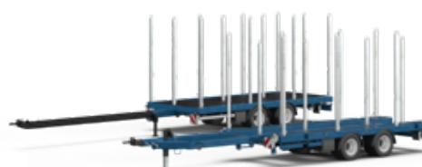
Remorques tandem pour camion