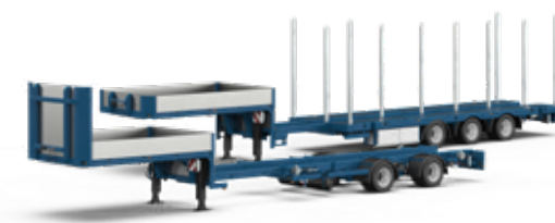
Semi-remorques pour camion