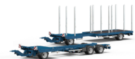
Remorques pour camion

Remorques, plateaux mobiles compatibles et aides au chargement