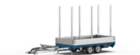
Remorques pour voiture