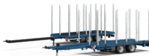
Remorques tandem pour camion