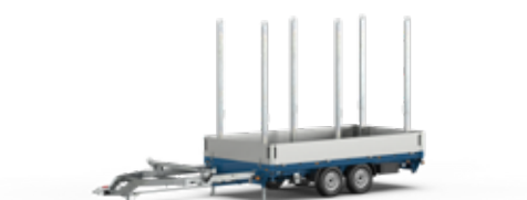
Remorques pour voiture