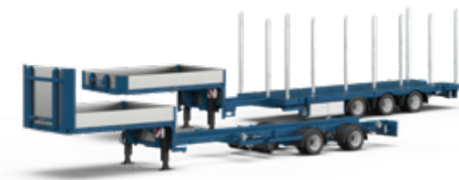
Semi-remorques pour camion