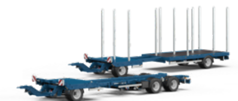
Remorques pour camion

Remorques, plateaux mobiles compatibles et aides au chargement