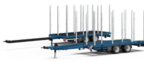
Remorques tandem pour camion