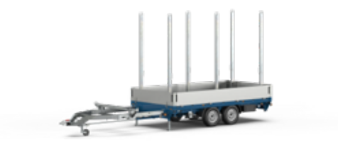
Remorques pour voiture